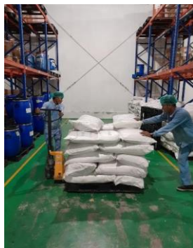
Gambar 2. Pendistribusian Bahan Baku

Berkaitan dengan beban kerja fisik, penulis mendapatkan masukan dari kepala bagian registrasi bahwasannya para pekerja raw material warehouse di PT. Triman tersebut memiliki pekerjaan yang terjun langsung ke lapangan dengan pekerjaan yang sangat berperan penting di dalam perusahaan tersebut. Gambar 1, menjelaskan bahwa pekerjaan diatas merupakan pengangkutan bahan baku yang selalu dikerjakan oleh para pekerja raw material warehouse . Proses tersebut dilakukan sebanyak paling sedikit 5 sampai yang paling banyak 8 pengangkatan dalam sehari. Dalam proses tersebut para pekerja harus mempersiapkan fisik yang prima dikarenakan dalam setiap satu sak bahan baku seberat 25 kg. bahan baku akan dipindahkan ke hand pallet dengan setiap hand pallet bisa menampung sampai 12 sak bahan baku. Dengan begitu dalam setiap 1 pengangkutan bahan baku bisa sampai seberat 300 kg.