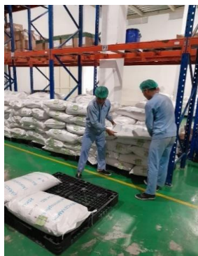
Gambar 1. Mengangkat bahan baku

PT. Triman perusahaan farmasi nasional yang memproduksi obat-obatan dan berlokasi di daerah Rancaekek, tepatnya di Jalan Pendeuy Km 1 pada tahun 19. Khususnya pada pekerja bagian raw material warehouse terdiri dari 4 orang pekerja. Pekerja bagian tersebut membutuhkan tenaga ekstra dikarenakan tugasnya seperti mengangkat, mendorong, menimbang bahan bahan baku yang ada di gudang bahan baku tersebut. Berdasarkan hal tersebut, peneliti melakukan observasi awal untuk memastikan kendala apa yang dihadapi, dengan hasil dinyatakan bahwa di PT. Triman ini memiliki permasalahan khususnya pada pekerja bagian raw material warehouse yang mengalami keluhan secara fisik dengan kondisi pekerjaan yang ada.