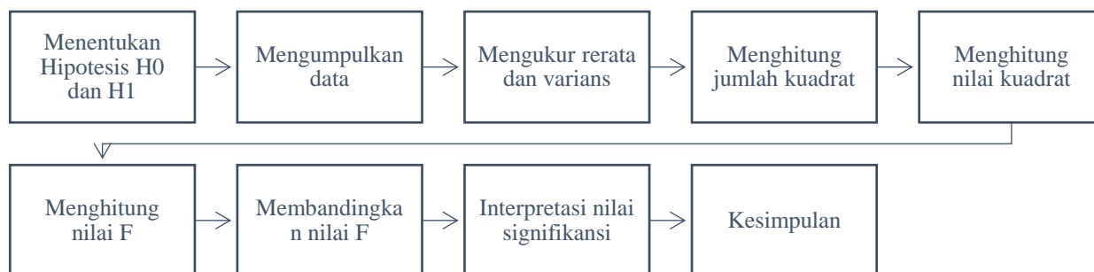
Gambar 2. Bagan Alir Penelitian

Anova merupakan metode dengan tahapan sebagai berikut: